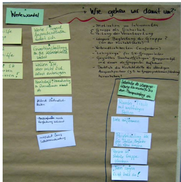
Eine der erarbeiteten Wandtafeln

Die anschließend herausgearbeiteten Trends in der Selbsthilfe lassen sich in übergeordnete Themen wie demographischer Wandel, Zunahme psychosozialer Themen bei jungen Frauen und in eher basisnahen Themen wie Wertewandel in Selbsthilfegruppen, Leistungsvermögen von Kontaktstellen gegenüber den neuen Themen/Gruppen, Selbsthilfe als Übergangslösung differenzieren.